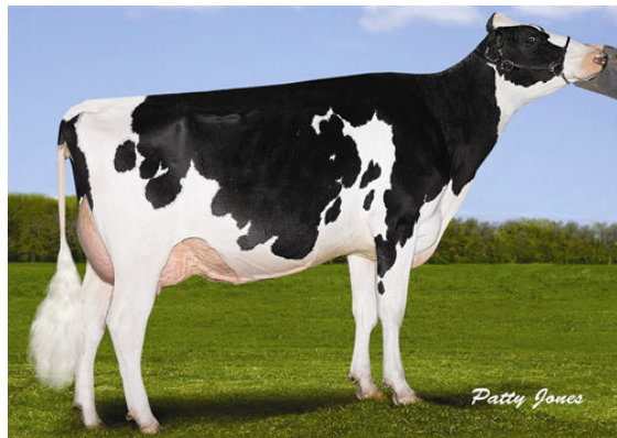
MYSTIQUE MAN O MAN CHER