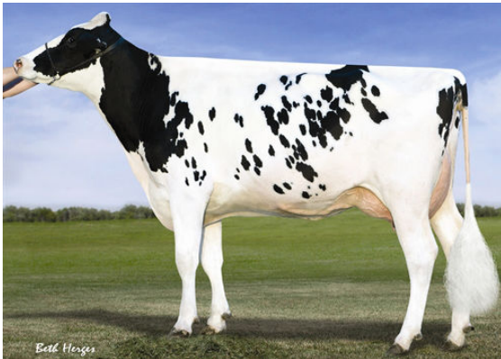
VISION-GEN SH SHO A12037