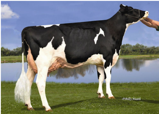
KY-BLUE GW DANA