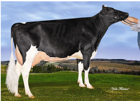
AMITIES MAN O MAN LOVELY