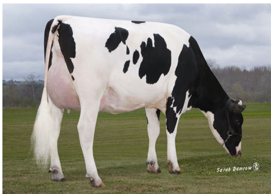
SGD RECORD 15893