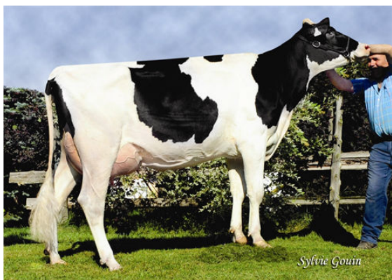
GÉPAQUETTE BOLTON RAVISANTE