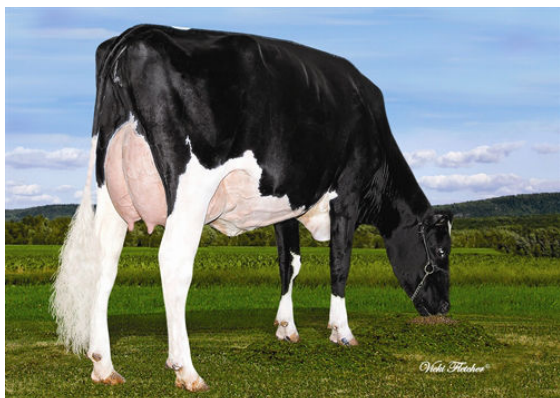
VAL-BISSON LACTA RANI