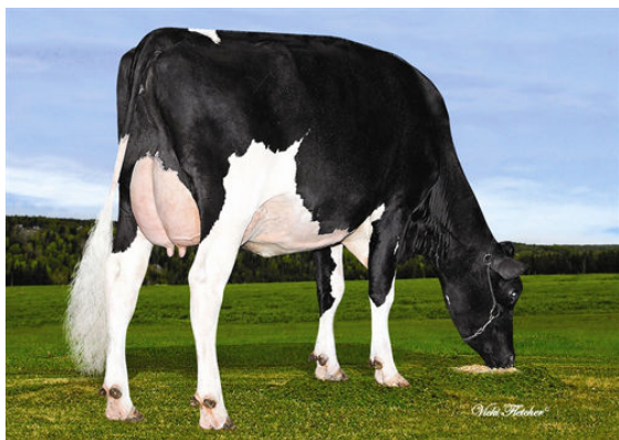
MICHERET ACYKA LACTA