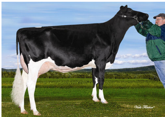
VAL-BISSON LACTA RANI