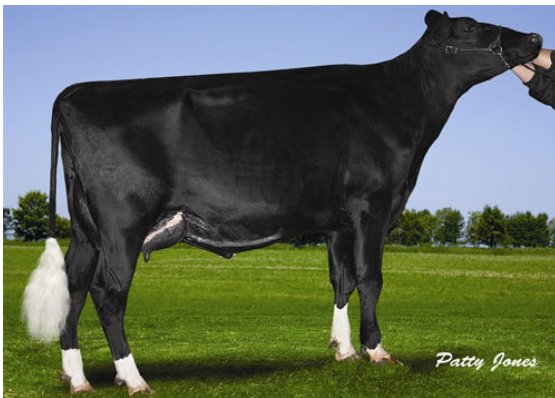
TROITREFLES COUGAR PICTURE