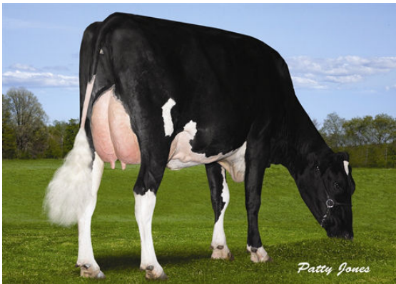
CARISS COUGAR RUNAWAY