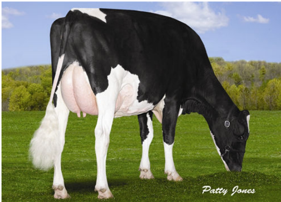
WALNUTKNOLL COUGAR GINA