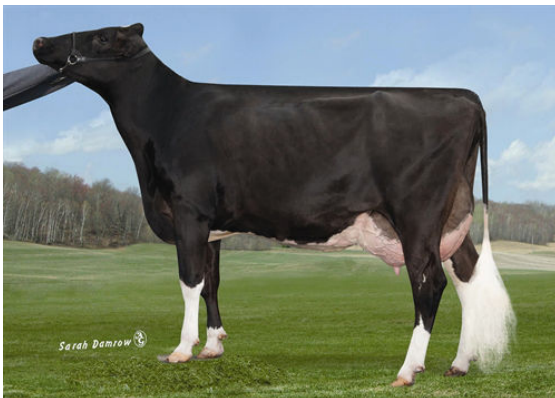
K-MANOR ALEX SIMPLICITY