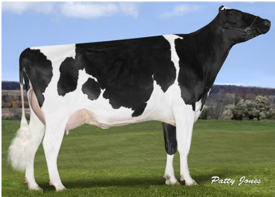
STANTONS JETSET ESIRNUSA