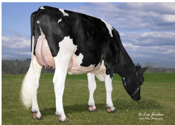
WOLDT BRIGHTLITE 6556