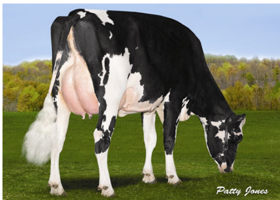
VELTHUIS SUPERSONIC ALYSSA

Left to Right AGRIMATIC SUPERSONIC JOLANE, VELTHUIS SUPERSONIC ALYSSA, NAVS-SG RIESLING