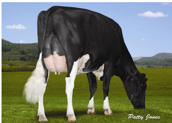
MORSAN SUPERSONIC S LILA Z