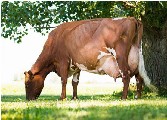
MARBRAE OBLIQUE'S CAMBRIDGE THIRD DAM