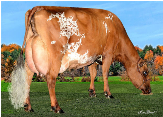
DUO STAR BURDETTE AMARA