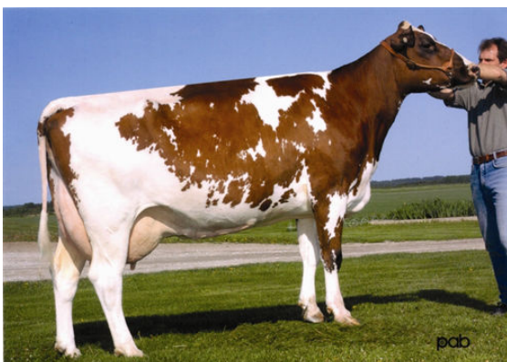
LACHUTE ROAD H S SALEM