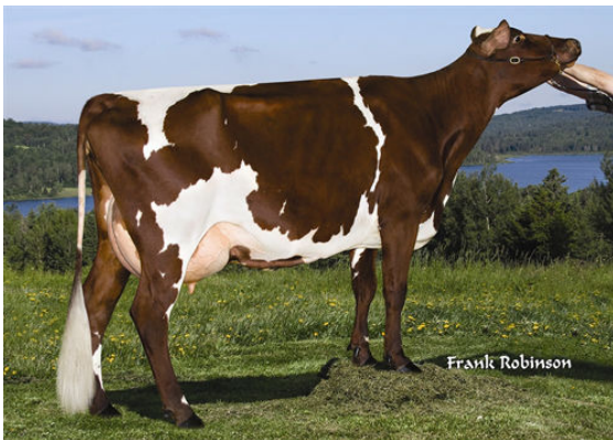
KAMOURASKA POKER RUBIS GRANDDAM