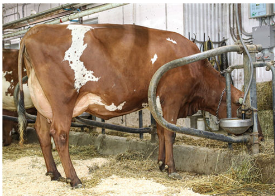
LADY IN RED PARRAIN IMPALA