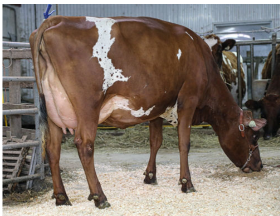
LADY IN RED PARRAIN IMPALA