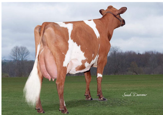
LA SAPINIÈRE CHELYO