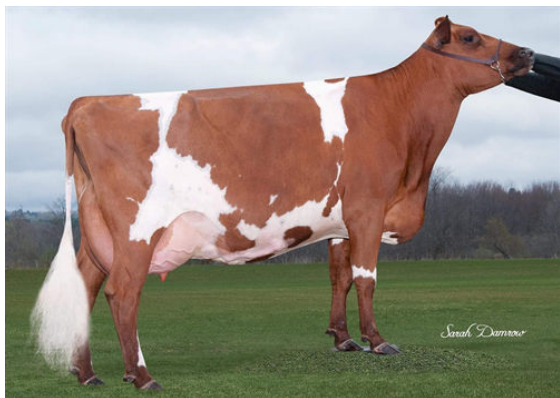
LA SAPINIÈRE CHELYO