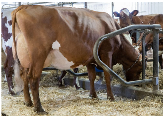
LA CROISEE CHELYOTE ELIZA