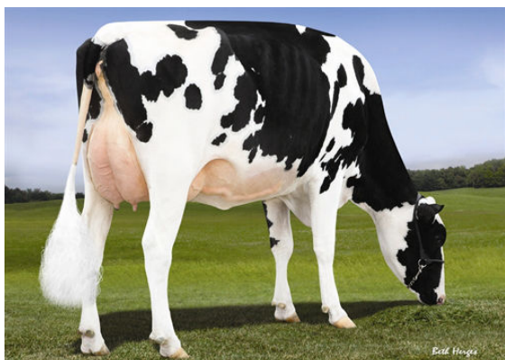
LOOKOUT PESCE EPIC HUE FOURTH DAM