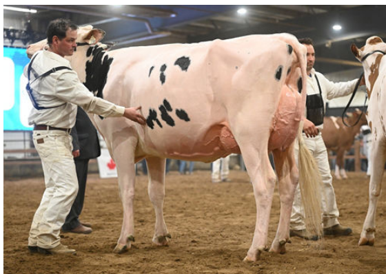
VOGUE MIRAND HANAIEI-P DAM