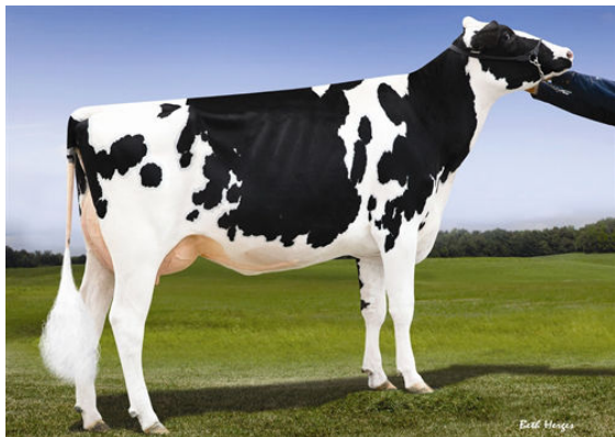
LOOKOUT PESCE EPIC HUE FOURTH DAM