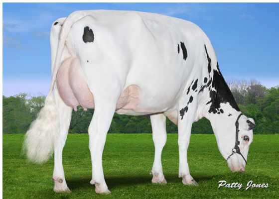
CLAYNOOK CLARISSA SPRING