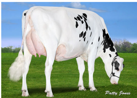
CLAYNOOK COLITA BOMBERO