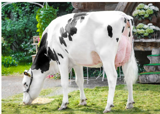
CLAYNOOK LUSTER CYNAR SG