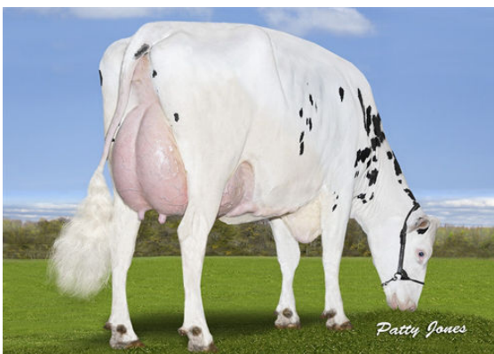
CALBRETT KINGBOY MIRANDA P THIRD DAM