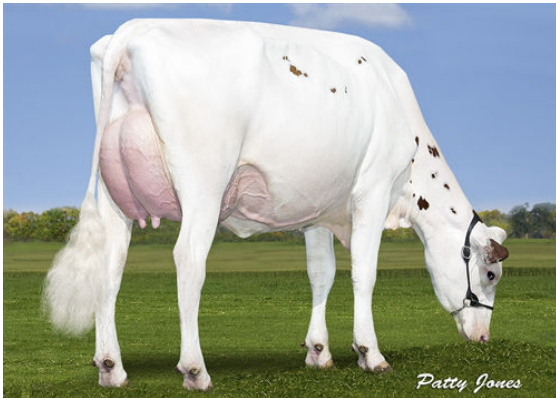
SNOWBIZ LADD P MARSHMELLOW FOURTH DAM