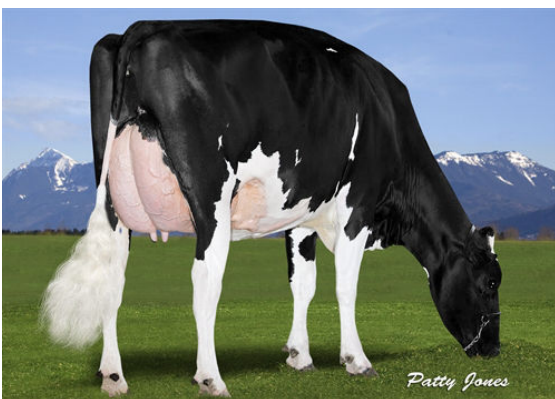
VIEW-HOME DRMAN WSCONSIN