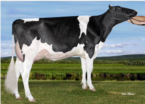
AIJA KING-DOC WICHITA