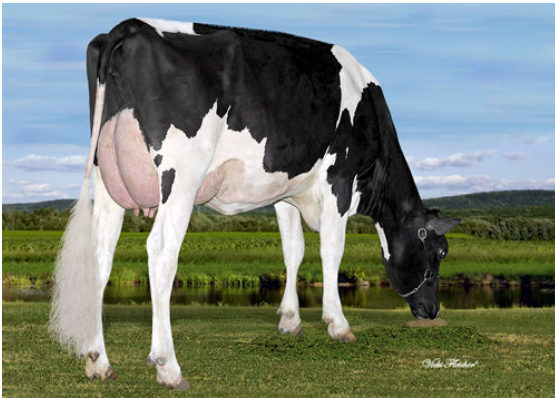
AIJA KING-DOC WICHITA