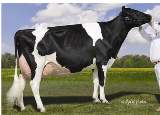
LYLEHAVEN LILA Z