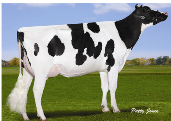
CALBRETT SNOWMAN LEXIE