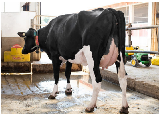
PROGENESIS CHARLEY TULIP THIRD DAM