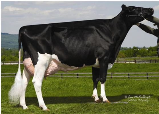
RC-LC GOLDWYN ATM FIFTH DAM