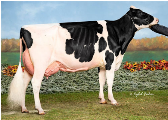
BENBIE LAMBDA ASHLEY DAM