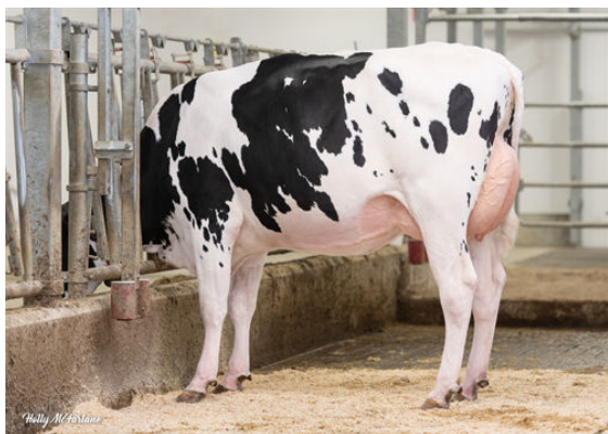
CLAYNOOK CARMEN HOLYSMOKES DAUGHTER