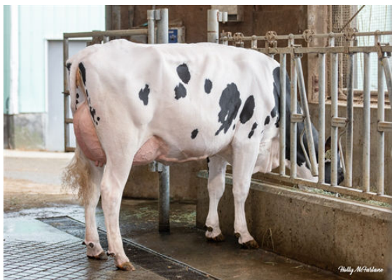
PROGENESIS HOLYSMOKES MADAM DAUGHTER