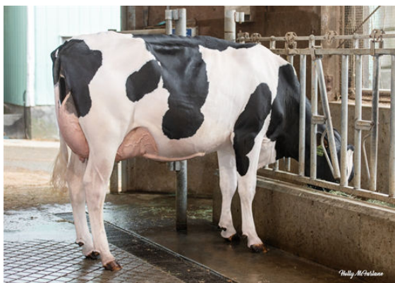
WESTCOAST HLYSMKS ZAZZLE 14011 DAUGHTER