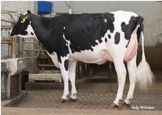
WELCOME ESPN HIPNOTIC DAUGHTER