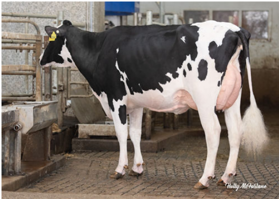
WELCOME ESPN HIPNOTIC DAUGHTER