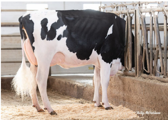
WELCOME ESPN HIPNOTIC DAUGHTER