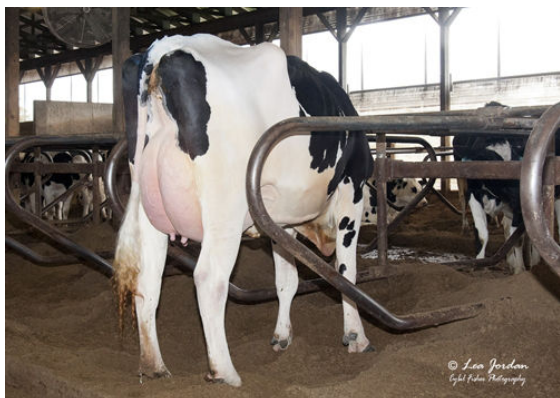
OCD BURLEY FRANCES 41330