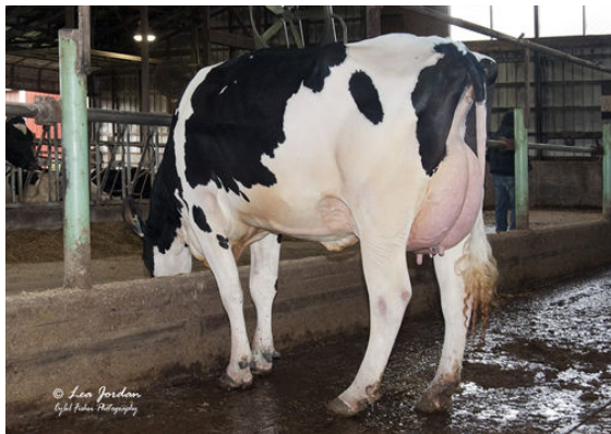
OCD BURLEY FRANCES 41330