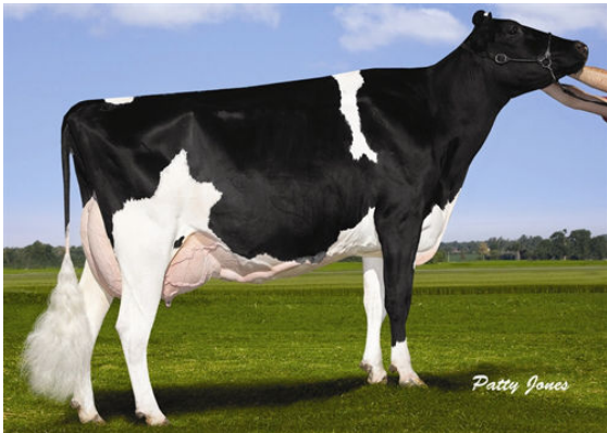
COMESTAR GOLDWYN LILAC FOURTH DAM