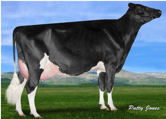
IHG TANGO GAFNEY GRANDDAM