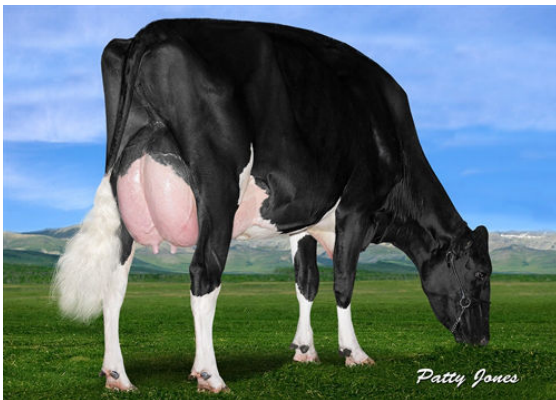
IHG TANGO GAFNEY GRANDDAM