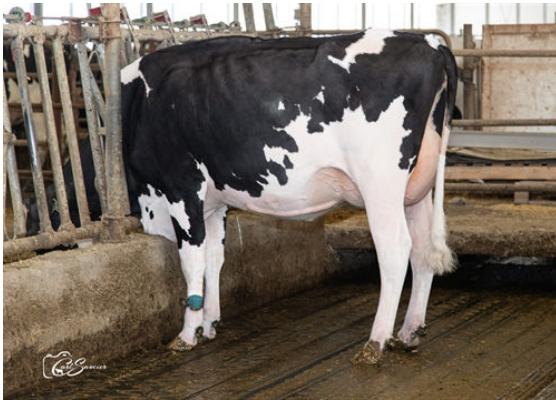
PELLERAT WEBSTER P DECCOX DAUGHTER