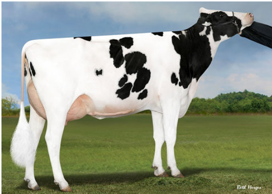
PEAK PAXTON SPRING 60034 DAM