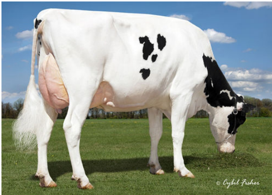
SANDY-VALLEY UNO PAXTON GRANDDAM