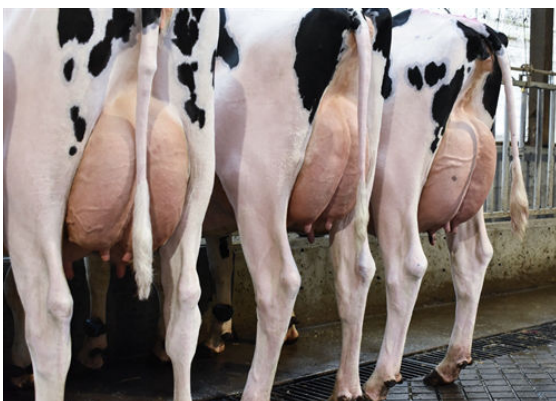
ALCOVE DAUGHTER GROUP

L-R WESTCOAST ALCOVE KOO 7550, WESTCOAST ALCOVE LOYAL 8347, WESTCOAST ALCOVE SILV3063 8221