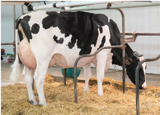
DESROSS ALCOVE STORTI DAUGHTER