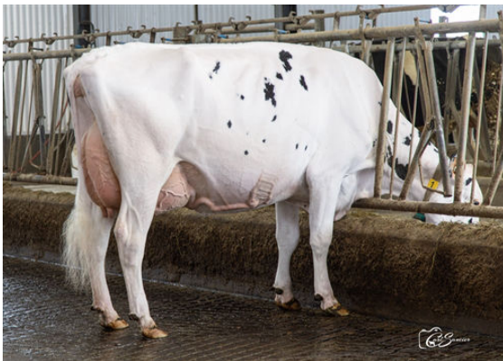
DUPORTAGE ALCOVE FROZEN DAUGHTER