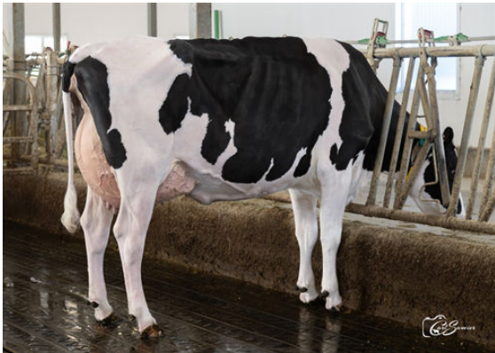
LEOTHE POSITIVE DEBUT DAUGHTER