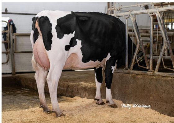
PROGENESIS PADAWAN GALLUP