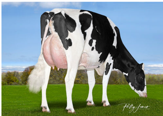
VOGUE PADAWAN ELUSIVE-P DAUGHTER