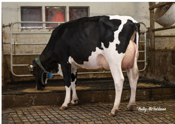
PROGENESIS PADAWAN GALLUP