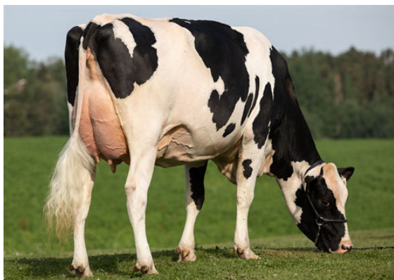
PROGENESIS GRANITE MORTAR