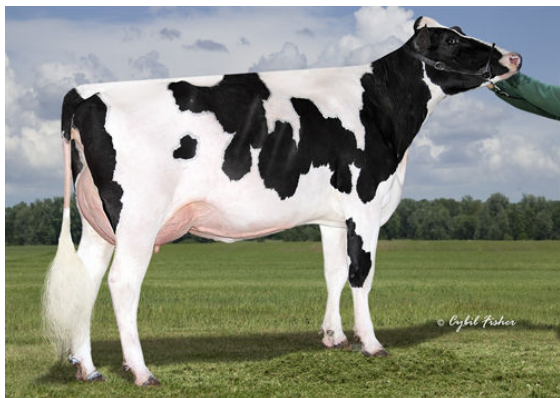
SIEMERS GRT PARINI 28262