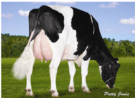
REGANCREST RBST BLOSSOM