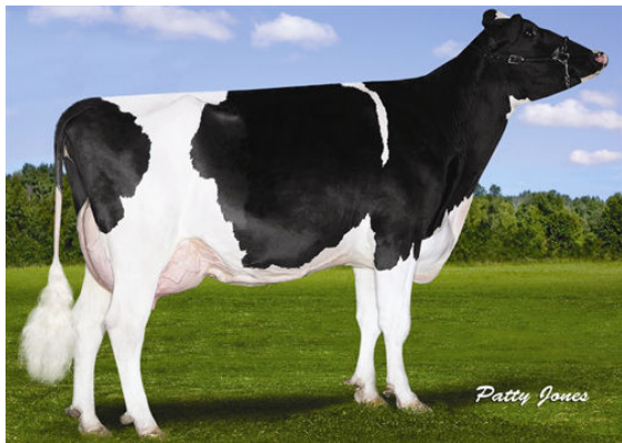
REGANCREST RBST BLOSSOM