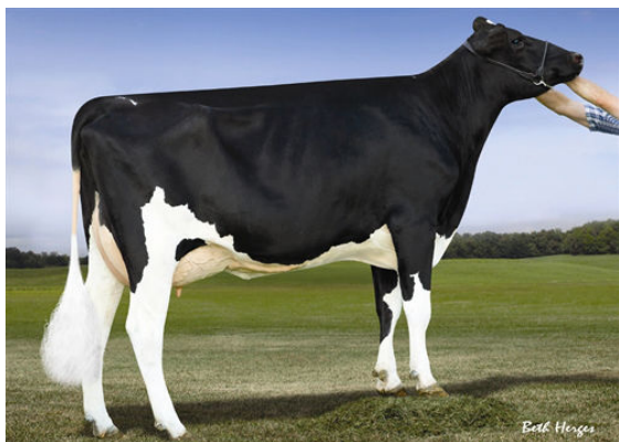
FUSTEAD ARMITAGE SELAH