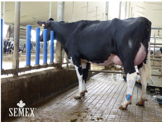
DARCROFT A F I PLATOON