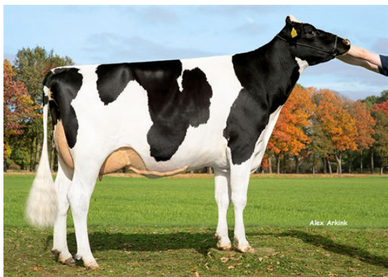
3STAR OH ROXANNE DAM