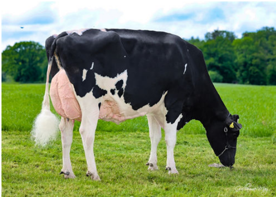
CCC UNDENIED SOMETIMES GRANDDAM