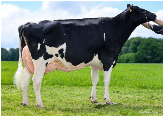
CCC UNDENIED SOMETIMES GRANDDAM