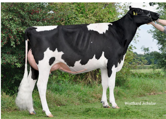
CCC COMMANDER SUMMER THIRD DAM