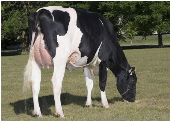
WALNUTLAWN ABBOTT BREEZE