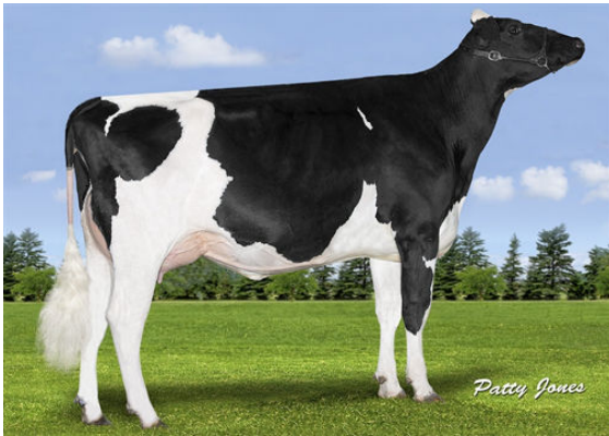
WALNUTLAWN ABBOTT BREEZE