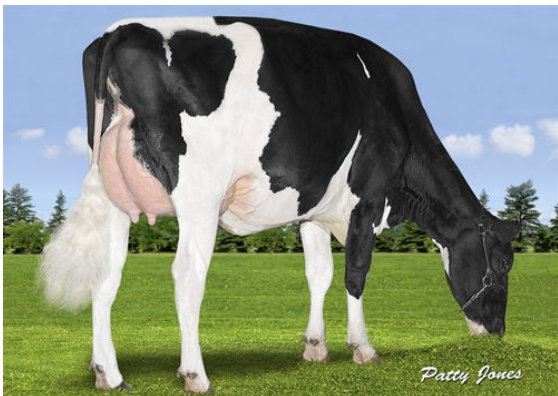
WALNUTLAWN ABBOTT BREEZE