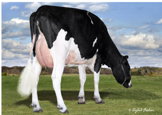
SCHREIBERDALE SOCIETY 3630