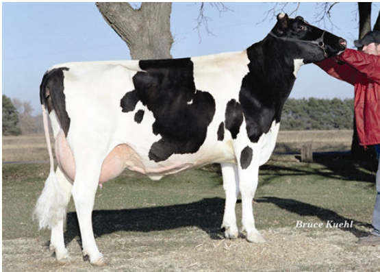
RALMA CONVINCER FEAST FIFTH DAM