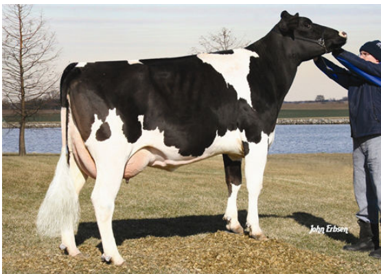
RALMA OUTSIDE FS THRILL FOURTH DAM