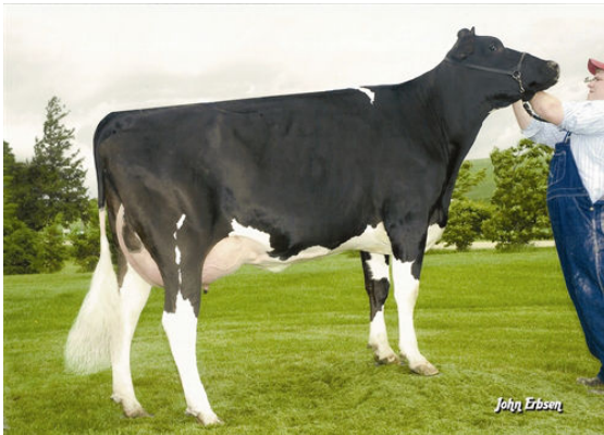
HENDEL-VATLAND SAM TARA THIRD DAM