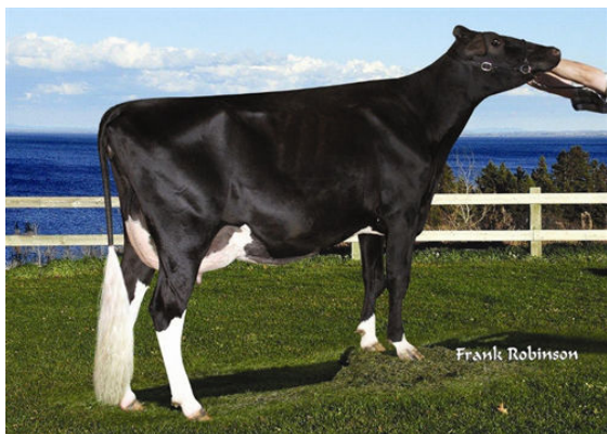
JEANRI BOLLY PETALE