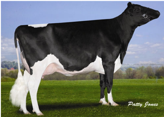
PARAMOUNT-MB OBSRV AGATE Dam