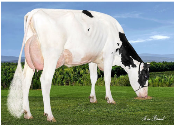
VAL-BISSON EXTREME SALVIA