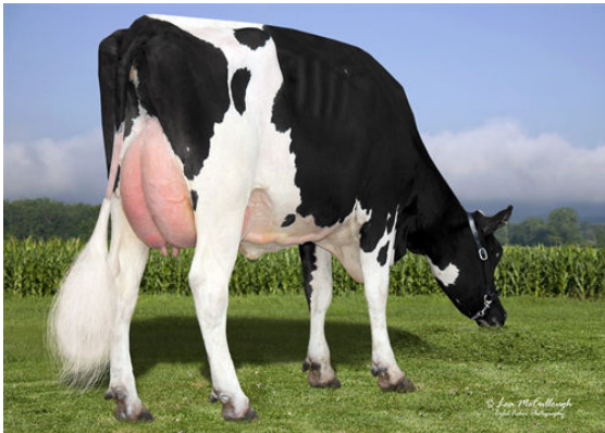
GIL-GAR L-COME SPRITZ