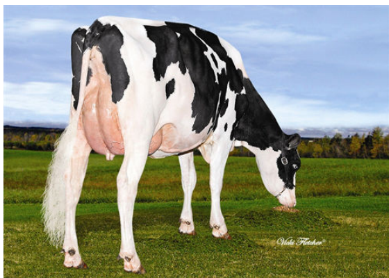
BURN DEXTERMAN SUNNY