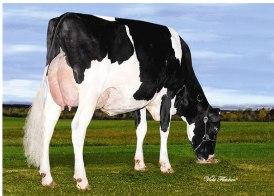
TINBER J BARBIE DEXTERMAN