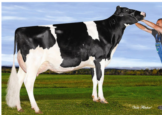
TINBER J BARBIE DEXTERMAN