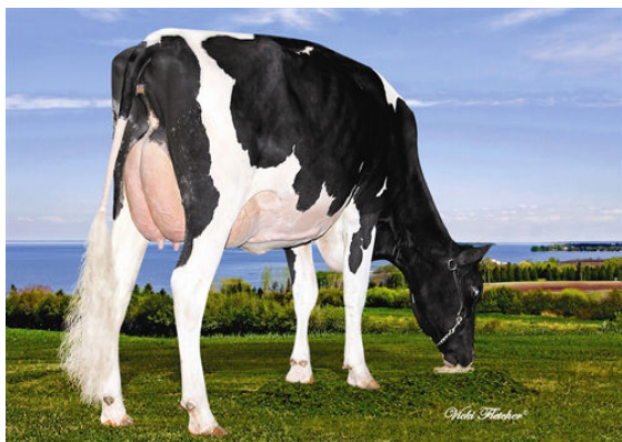
RAYNALYNE MURDOCK MODULACE