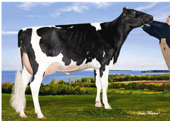
RAYNALYNE MURDOCK MODULACE