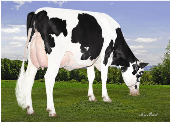
DU PETIT CANTON AFTERRH MARTINE