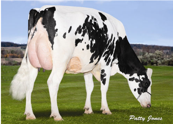
STANTONS AFTER MILKSHAKE