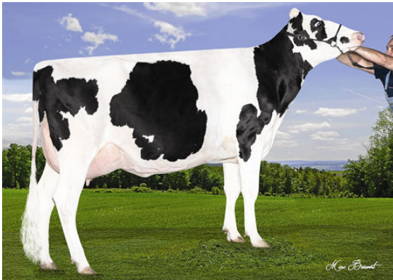
DU PETIT CANTON AFTERRH MARTINE