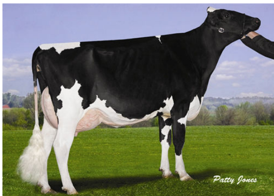
MISTY SPRINGS WILDMAN BREEZY Dam