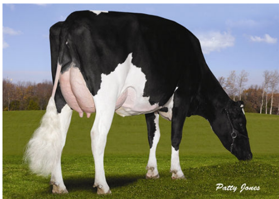
MARKRIDGE MARKER EVIE