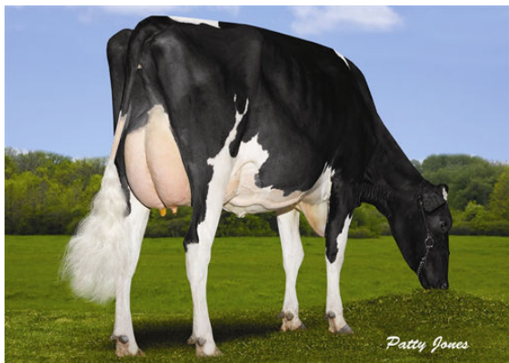
WEBERVILLE MARKER FLOWER