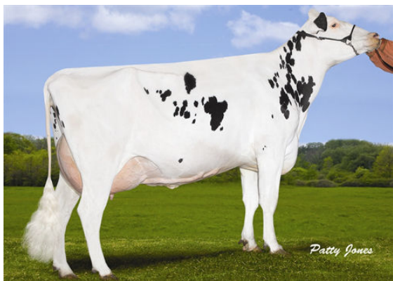
DANENVIEW MARKER TORY